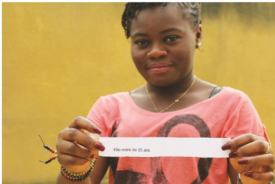
Figure 2: Photo prise par le RAJP en 2016

Malheureusement, les auteurs de ce rapport ont constaté que jusqu'à présent, très peu de ces enfants ont bénéficié de prises en charge psychologique pour leur permettre de se libérer du traumatisme dont ils ont été victimes. Par conséquent, nombreux sont les enfants qui ont grandi avec des traumatismes créant en eux la haine avec l'idée de pouvoir se rendre justice dès qu'ils en auront l'occasion. A ce propos, au cours d'un atelier sur les mécanismes de justice transitionnelle en tant qu'outils de prévention des conflits, un chef traditionnel a relaté les propos d'un enfant déscolarisé du fait de la guerre et qu'il a tenté de ramener à l'école : « je connais celui qui a égorgé mon père, il est dans le village. Quand j'aurai la force, je vais le tuer aussi » 12