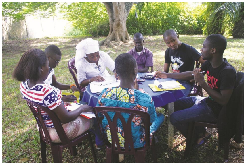
Figure 3: Consultations conduites par le RAJP en 2016 avec des jeunes sur leur vécu pendant les crises survenues en Côte d'Ivoire

Au titre des conséquences des crises successives, il convient également de noter la perte des valeurs morales dans la société ivoirienne en raison des conflits. La violence a été présentée aux jeunes, comme moyen d'expression pour avoir des résultats immédiats. Des contre-valeurs sont de plus en plus présentées comme des référents de la réussite sociale. Des acteurs clés de la violence connaissent une ascension sociale du fait d'être promu à certains poste de responsabilité. Les bons repères en matière d'éthique et de moral sont en train de disparaître.