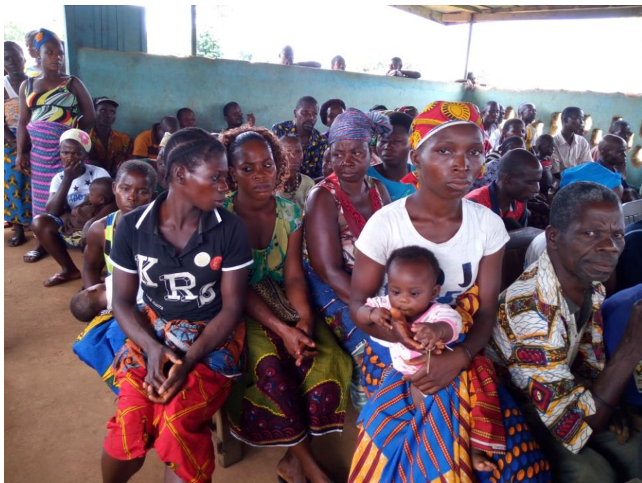
Figure 1: Consultations menées par la COVICI à Toulepleu en 2017

Les auteurs de ce rapport ont identifié plusieurs cas de femmes et jeunes filles victimes de viols qui ont contracté des grossesses non désirées après leur agression, ce qui constitue pour elles, une charge supplémentaire à la fois psychologique et matérielle. Plusieurs sont encore traumatisées parmi lesquelles certaines traînent en plus des séquelles physiques consécutives à la violence avec laquelle ces agressions ont eu lieu. En plus, de nombreuses victimes de viols affirment avoir été infectées par des maladies sexuellement transmissibles y compris le VIH-SIDA.