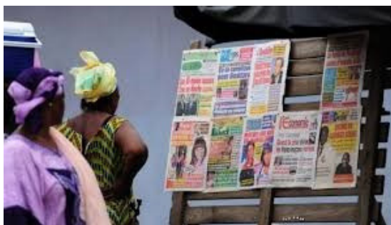
Figure 1: Des personnes en train de s'informer par la "titrologie"

Les médias privilégiés pour l'heure par le Ministère de la Solidarité sont la presse écrite, la télévision et la radio nationale ainsi que l'internet via les médias en ligne et les réseaux sociaux. Ces outils sont réputés pour avoir la plus large audience possible et être les plus prisés. Cependant, force est de reconnaître que ces médias ne sont accessibles qu'à des populations privilégiées des principales villes du pays. Les victimes consultées ont en effet relevé que les seules informations disponibles sur le processus le sont à travers la presse écrite ou la télévision nationale. Si ces canaux semblent être les plus accessibles, la réalité est tout autre, notamment dans les communautés reculées de l'intérieur du pays.