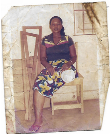
Photo prise en 2003 après l'amputation de sa jambe