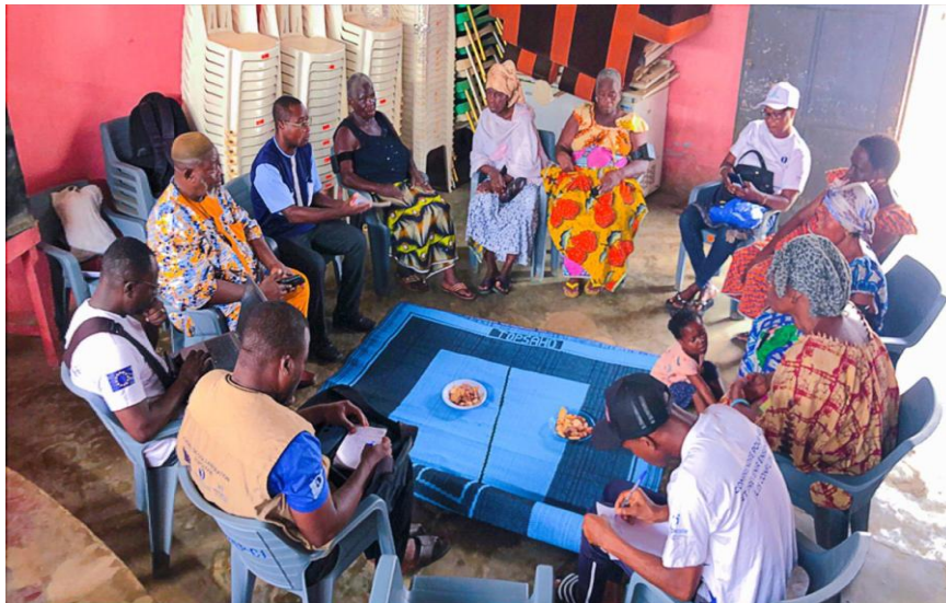
Séance de Ronde à Yopougon

En marge des rondes brésiliennes, 296 personnes ont été accompagnées par des psychologues et/ou des psychiatres.