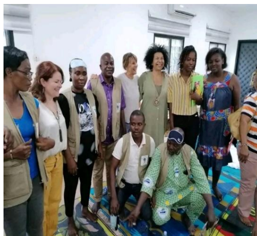
Photo de famille agents communautaires et formateurs en TCIS à Daloa

La deuxième formation sur le module 2 s'est tenue du 29 juin au 3 juillet 2023, à Guiglo, avec pour thème « La crise ».