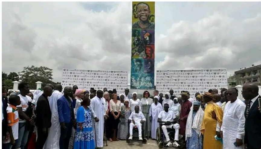
Photo de famille avec les officiels et victimes devant la stèle d'abobo

Ces stèles constituent un espace de recueillement, de respect et d'hommage pour les familles affectées et pour toutes les communautés, renforçant ainsi le processus de guérison des blessures passées.