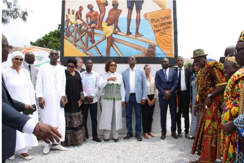
Photo de famille avec les officiels devant la stèle réalisée à Yopougon