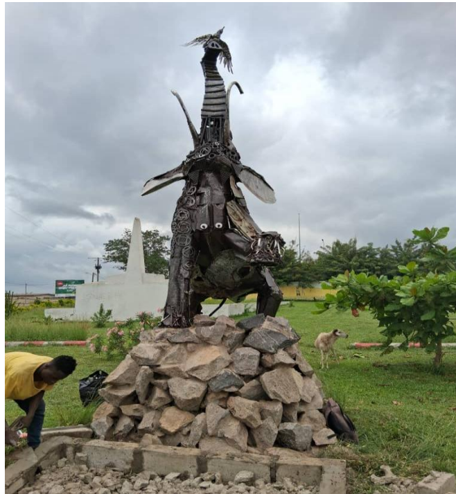
La stèle de Duékoué

Le 20 novembre 2023 dans la salle Madhta de la Mission Catholique, l'AVSI a présenté aux autorités administratives coutumières la maquette d'un monument. Il s'agissait d'un éléphant qui tient au bout de sa trompe une colombe. Selon les artistes culturels en charge de sa réalisation, l'éléphant sera bâti sur socle de 1,5 m composé de blocs de pierres locales. Le tout à une hauteur de 3,5 m