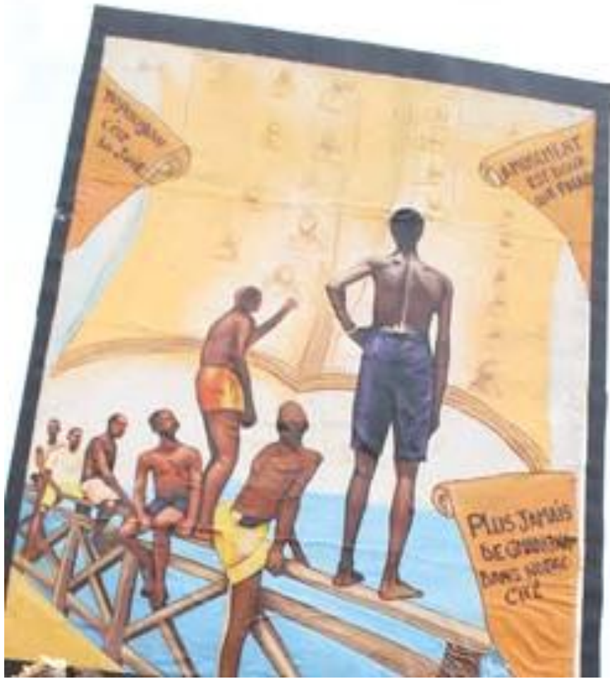
Œuvre mémorielle de Yopougon Yao-Séhi