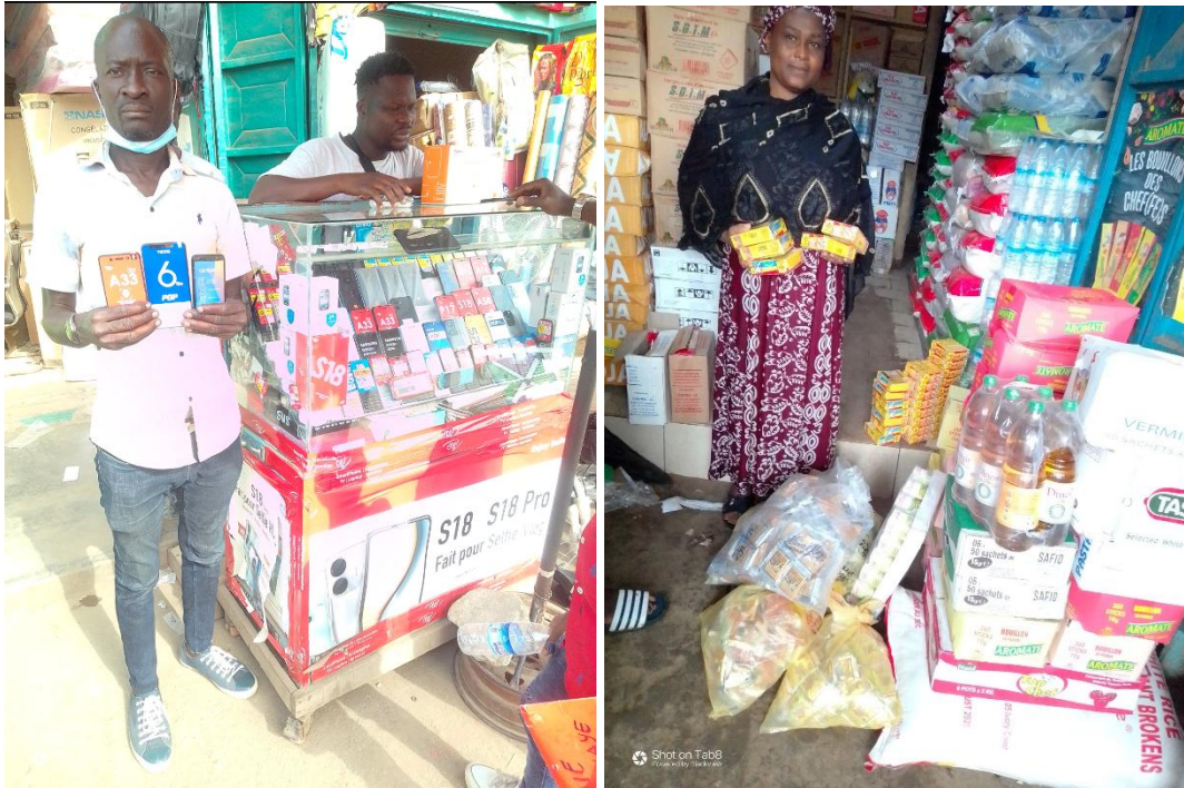
Soutien matériel de certaines victimes