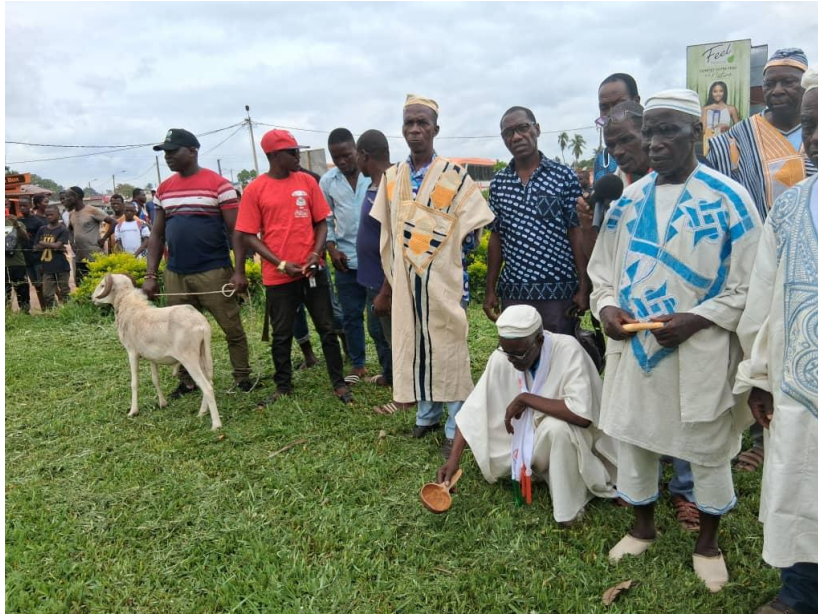
Cérémonie de libation à Duékoué

Selon le Représentant pays de l'Association italienne de volontaires œuvrant pour le développement et l'aide humanitaire (AVSI), structure d'exécution de ce projet financé par le FPV Lassiné Bamba, cette œuvre mémorielle, symbole de reconnaissance, s'inscrit dans la continuité des actions de réparation collective et de traitement du passé.