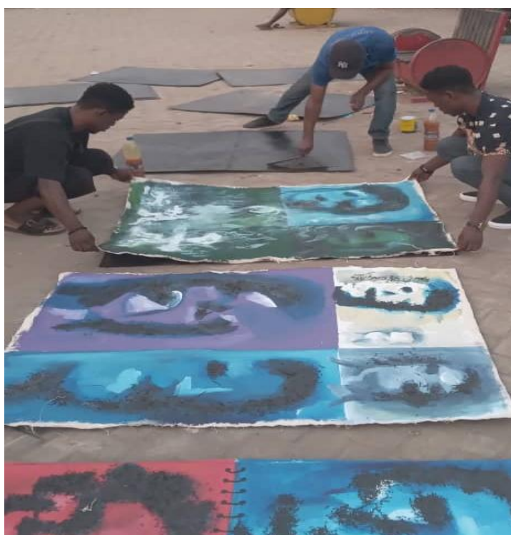
Préparation des éléments de la stèle par les artisans

Le 03 mars 2024, en marge de la cérémonie d'hommage aux 7 femmes tuées en 2011 lors de la crise post-électorale, le FPV a procédé à la pose de la première pierre d'une stèle commémorative au rond-point d'Abobo Banco.