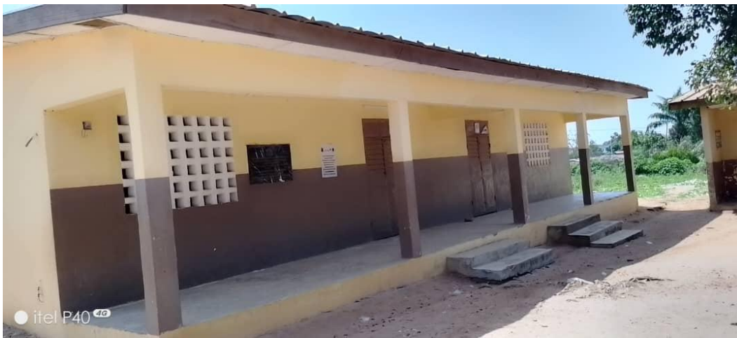
Salles de classes réhabilitées au quartier carrefour

A Duékoué, l'AVSI a réalisé en 2022 une fontaine à la mosquée Kéïta et a lancé la réhabilitation de salles de classe.