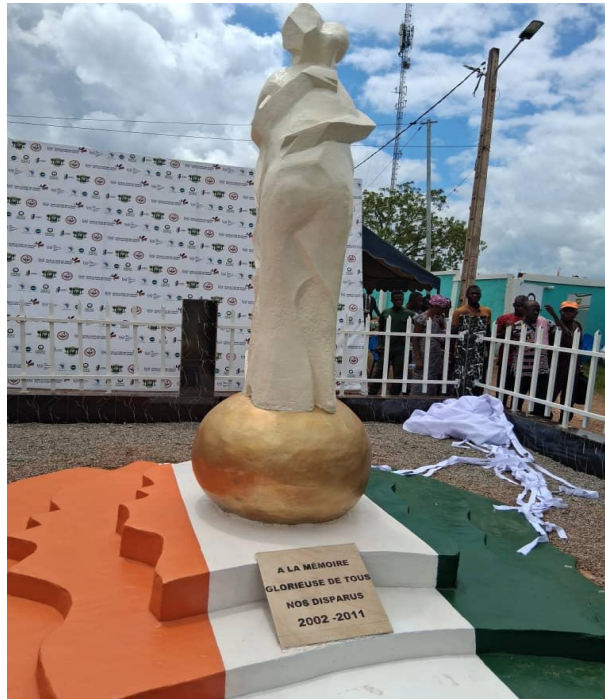
La stèle de la réconciliation à Bloléquin