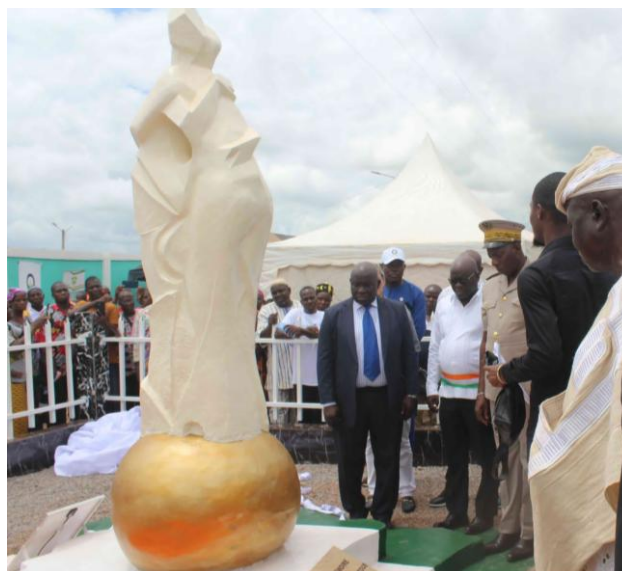
La stèle de la réconciliation à Bloléquin