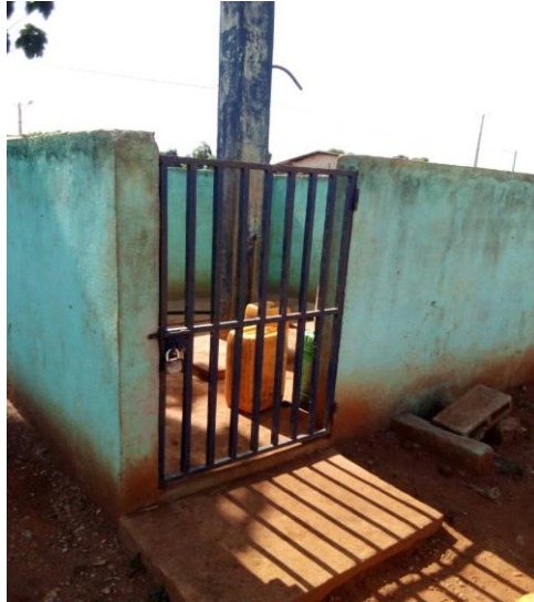
Salles de classes et Pompe hydraulique villageoise réhabilitées à Fiékon (Vavoua)