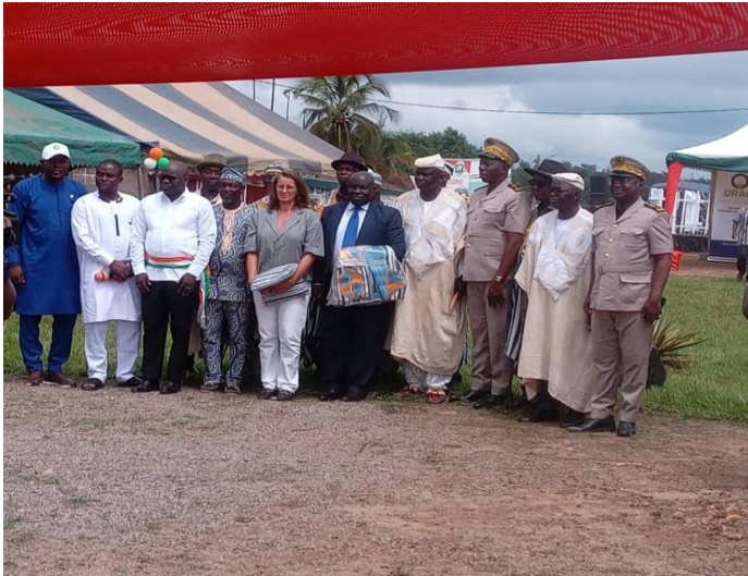
Photo de famille à l'issue de la cérémonie à Bloléquin

Concernant la symbolique de la statue, elle présente deux personnes s'enlaçant, illustrant la réconciliation, l'amour et le pardon. Elle incarne la fin des rancœurs et la volonté commune d'enterrer définitivement la hache de guerre. Toutes les communautés, sans distinction, ont ainsi affirmé leur engagement pour la paix.