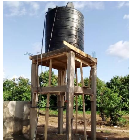
Mini château d'eau construit par AVSI à Monoko-zohi et Fiékon