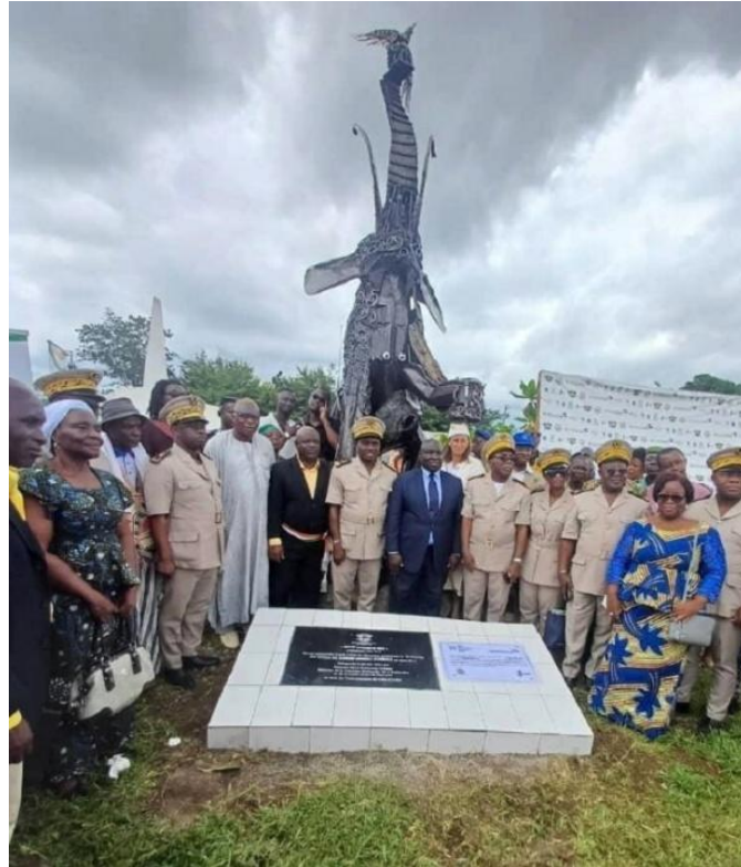
Photo mémorielle autour de l'œuvre mémorielle "Douê Souhoun Min" (l'éléphant se lève en langue Wê), jeudi 29 mai 2025, à Duékoué