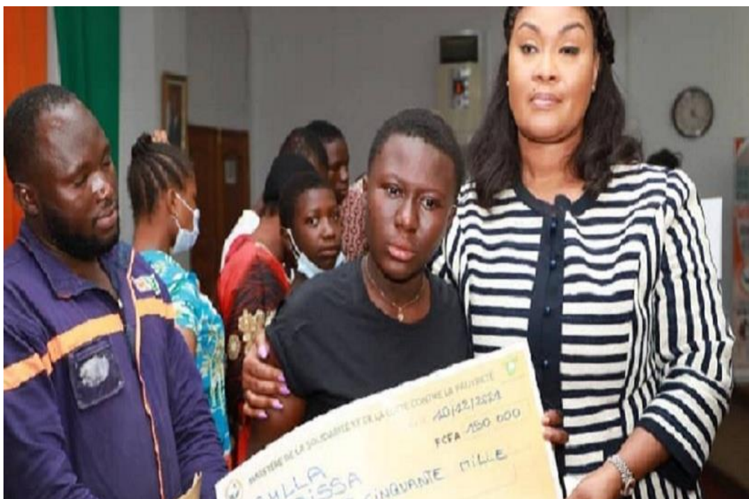
Remise de bond de PEC scolaire par la ministre Myss Belmonde DOGO à un orphelin à la date du 10 Décembre 2021 6