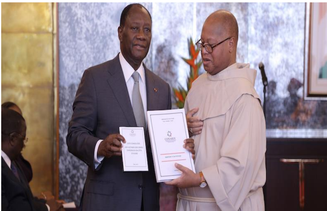
Rapport de la CONARIV remis officiellement au président de la République sem Alassane Ouattara par Mgr Ahouanan le 19 avril 2016

Par ailleurs, contre toute attente, le Ministère de la Solidarité a procédé le 30 Octobre 2017, au lancement de la grande phase d'indemnisation des victimes. Au cours de cette cérémonie, 263 victimes issues de la base de données de la CONARIV ont été indemnisées. Ce qui rajoute aux questionnements des victimes qui se demandent par quel mécanisme le ministère avait pu extraire la liste des 263 personnes indemnisées ce jour. Pendant ce temps, les conséquences de ce énième blocage sont préjudiciables aux victimes, qui sont toujours dans l'expectative surtout que le ministère ne communique pas régulièrement avec les victimes sur les avancées concernant l'exploitation de la base de données.