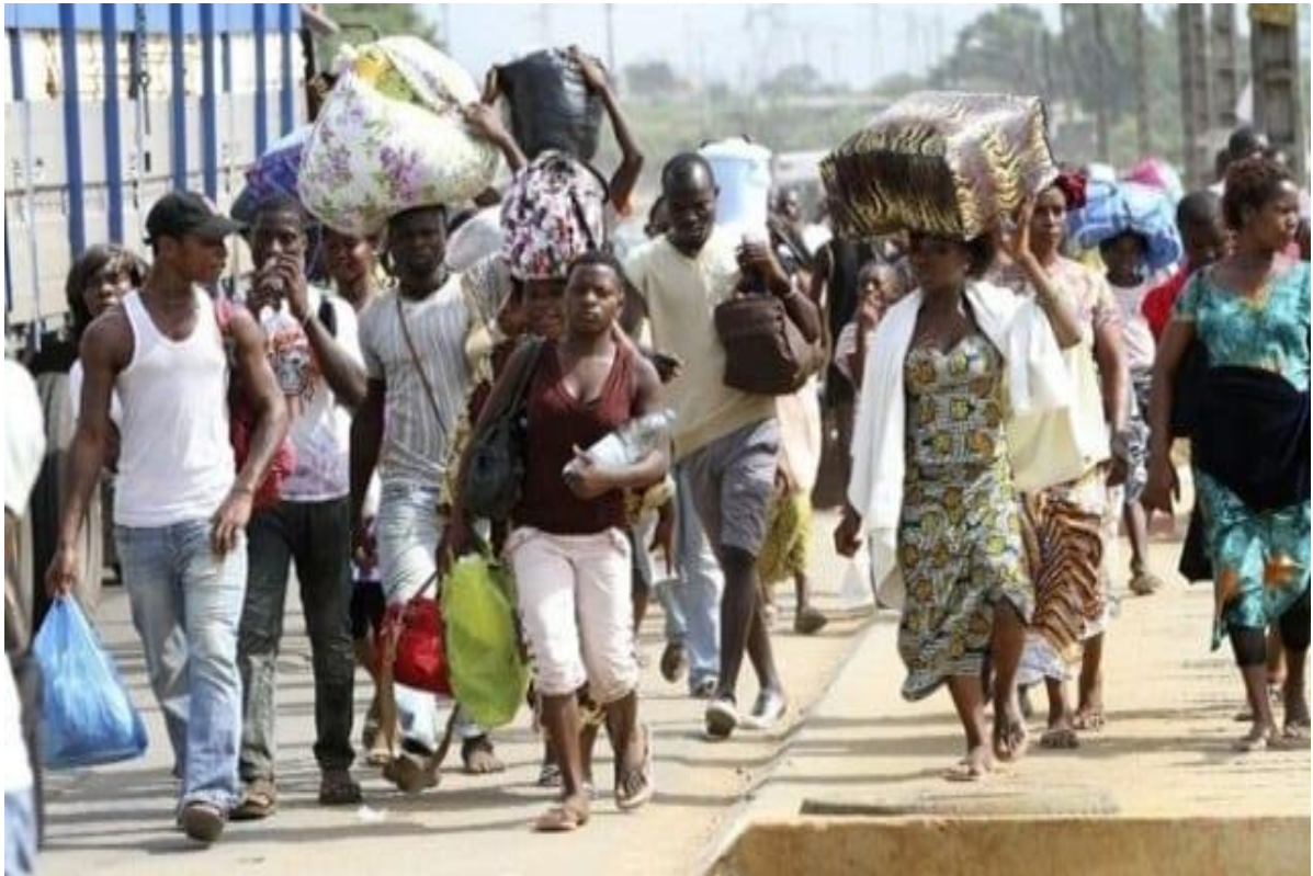
Des populations fuyant des zones de tensions chaudes lors de la crise post-électorale 2010-2011